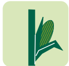
Moy. hauteur épi = TC1 177