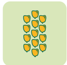
Nbre de grains/rang 26-30