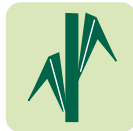
Port de feuilles semi-retombant