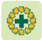
Nbre de rangs 16