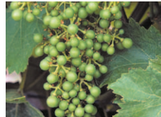
B Fermeture de grappe