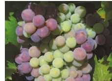
C Début véraison