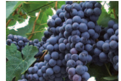
D Ramollissement des baies à 10 j - 15 j avant vendange