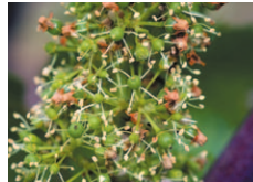
A 80% chute capuchons floraux